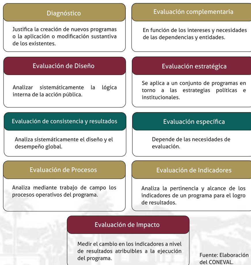
Figura 2. Tipos de evaluaciones según los lineamientos

Las evaluaciones a las que podrán estar sujetas el fondo mencionado con antelación podrán ser de: